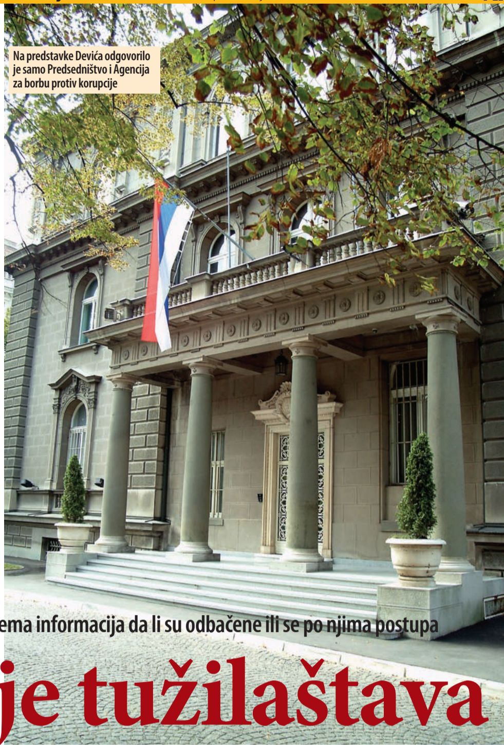
Na predstavke Devića odgovorilo je samo Predsedništvo i Agencija za borbu protiv korupcije