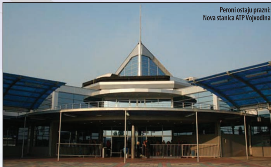
Peroni ostaju prazni: Nova stanica ATP Vojvodina

U ponovnom odlučivanju o zahtevu za nadoknadu štete, koje je započelo još u januaru ove godine, prvostepeni sud je najpre zatražio saobraćajno veštačenje, kojim je potvrđeno da je volja grada bila samo jedna autobuska stanica, ona koju je izgradila ATP Vojvodina. Iako je paralelno moglo da se radi i finansijsko veštačenje, sud je tek u aprilu ove godine doneo rešenje, ali je po zahtevu stečajnog upravnika, veštaku naložio sa-