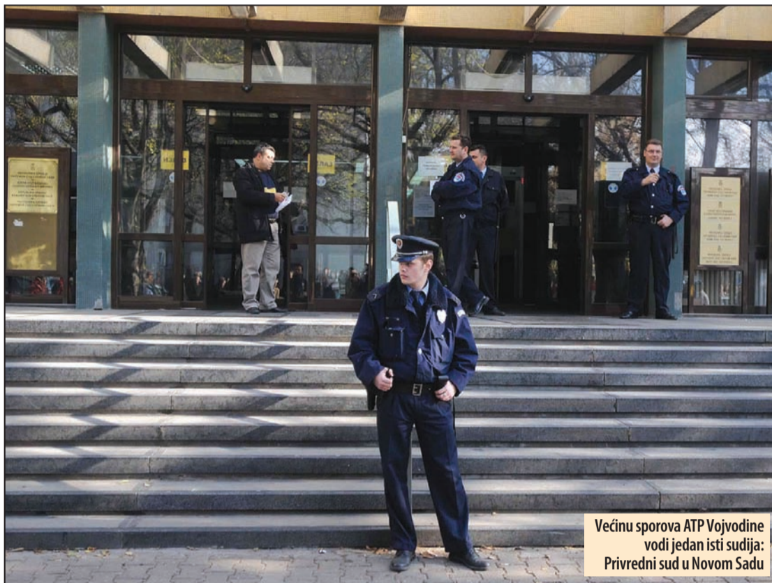
Većinu sporova ATP Vojvodine vodi jedan isti sudija: Privredni sud u Novom Sadu

- Krivično delo za koje se tereti Dević, u zakonu je definisano kao namera poreskog obveznika da izbegne plaćanje poreza po odbitku, koji se, inače, obračunava prilikom isplate ličnih dohodaka zaposlenih. Za postojanje krivice, nužno je da postoji namera, umišljaj. U ovom slučaju toga nema. Naime, Dević je ne samo obračunao i u poslovnim knjigama evidentirao poresku obavezu, nego je i plaćao 40 odsto od utvrđenog iznosa, kada je i kako mogao. Prioritet su imali radnici koji odlaze u penziju, kako bi mogli da imaju povezan staž, što ukazuje da je vodio računa i o socijalnoj dimenziji te obaveze. Takođe, sa Poreskom upravom je sve vreme bio u dogovoru o tome kako i kada će moći i koliko da uplati. Istovremeno, Poreska uprava imala je i obezbeđenje za taj dug, hipoteku koju je u slučaju potrebe mogla da aktivira, a u tom trenutku, postojala je i pretplata poreza po drugom osnovu, za PDV, koja je takođe mogla da se koristi za ove namene - kaže Stanojević i dodaje da zaključak prvostepenog suda o postojanju namere da se izbegne porez, u ovim okolnostima predstavlja nonsens.