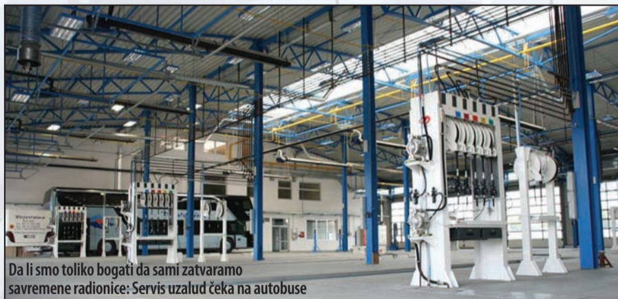
Da li smo toliko bogati da sami zatvaramo savremene radionice: Servis uzalud čeka na autobuse

Bilo kako bilo, već je sada jasno da je pred gradom visoka odšteta koju će morati da plate poreski obveznici. Bilo bi dobro da se ta presuda ne donese u Strazburu jer bi iznos u tom slučaju bio znatno viši. Ali koliko god da se dosudi, to će biti račun uspostavljen zbog toga što država nije uradila svoj deo obaveza. Ono što pada u oči jeste da postoji sinhronizovana aktivnost velikog broja državnih institucija, što je nemoguće ako nije diktirana iz jednog centra.